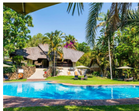
Safari Lodge zona Kruguer