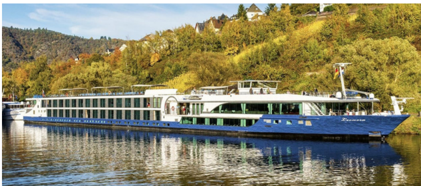
Vaixell MS Leonora 4*