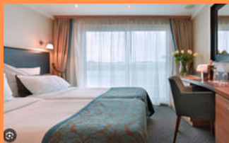
Categoria intermitja i superior en balcó